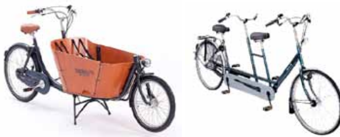
Een bakfiets en tandem